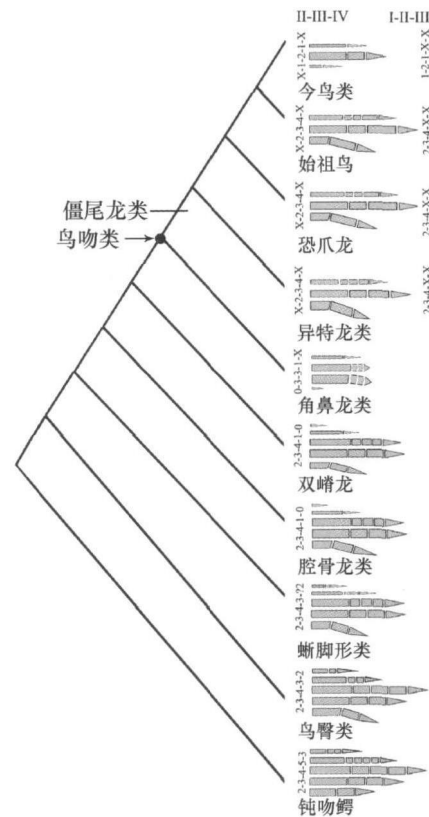
图 2 兽脚类恐龙手部演化示意图

一模式被认为是由兽脚类恐龙猎食行为需要的抓握功能造成的。像很多其他早期兽脚类恐龙一样，泥潭龙具有四个手指，但是其第一指却严重退化了，显示了一种与其他早期兽脚类恐龙完全不同的手指退化模式。这表明兽脚类的手指退化模式要远远比过去认为的复杂(见图 2)。通过重新观察和分析其他兽脚类恐龙的手部结构，我们发现其他许多兽脚类恐龙的手部特征其实也暗示着兽脚类恐龙的手指退化模式可能非常复杂。综合新的古生物学资料 and 现代发育学资料，我们提出了一种外侧转移假说来解释恐龙手指的演化：最早期的兽脚类恐龙由于受到猎食行为的功能性抑制，退化了最外侧的手指(第五指)；随后由于某些兽脚类恐龙丧失了猎食能力，手指退化不再受抓握功能的抑制，而回到由保守的发育机制来控制，因此开始退化第一指(最内侧的手指)；在具有三个手指的僵尾龙类演化早期，由于猎食功能的需要，已经退化的第四指重新演化成功能性手指。这样，僵尾龙类的三指应该是中间三指。